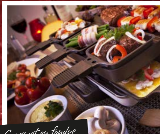
Gourmet en fondue

Gezellig met elkaar. Genieten van een hapje en een drankje. Met onze vleeswaren, toastsalades en al onze heerlijke delicatessen zet u gegarandeerd iets lekkers op tafel. Voor elke smaak.