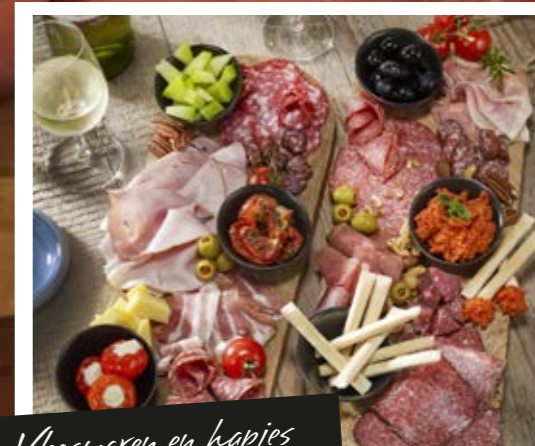
Vleeswaren en hapjes

De feestdagen lenen zich uitstekend voor een exclusief stuk vlees. Echte specialiteiten waarmee u voor de dag kunt komen. Wij hebben volop specialiteiten in huis en wij kunnen u adviseren op welke wijze u dit het beste kunt bereiden. Vraag ons naar de smakelijke mogelijkheden.